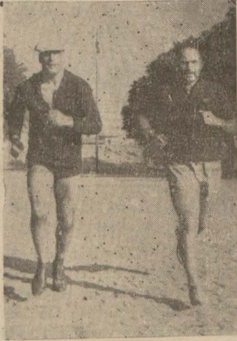
Dinarlı İdman yapıyor