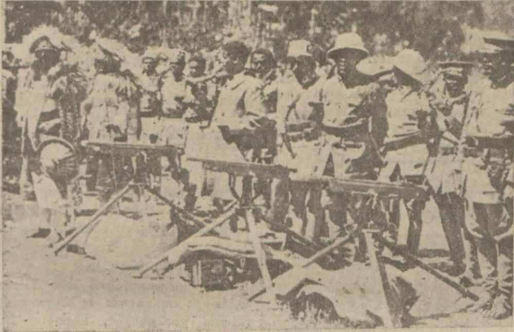
Habeş Ordusundan Mitralgozlu Kalabalık Bir Müfrez

Londra, 21 (Özel) — Sinirler çok gergin, umumi efkâr çok heyecandır. Çok korkulu günler yaşandığını anlatan alâmetler var. Gazeteler ateş pülküren, çok hiddetli makalelerle doludur. Kabineler acele toplantıya çağırıldı. Fransada istirahatta bulunan Başbakan Baldwin ile İsviçrede tatil geçiren Finans Bakanına da telefon edildi. Kabineler perşembe günü (yarın) toplanacaktır. İcap ederse parlamento da toplantıya çağırılacaktır. Şimdi bütün İngilterede, Habeş işinin, barış yollu halledilmesi için yapılan teklifleri reddeden İtalyaya ve Musoliniye karşı çok ağır bir hiddet havası hüküm sürüyor.