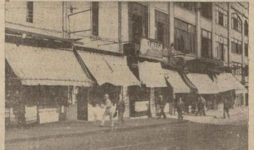
Duvarlarına Yahudilik ateşinde beyannameler yapıştırıldığı uydurması uydurulan Galata caddesinde Musevi yurttaşlarımızın çalıştıkları dükkânlar

Bunu kendimiz yaptığımız bir ( Devamı 8 inci yüzde )