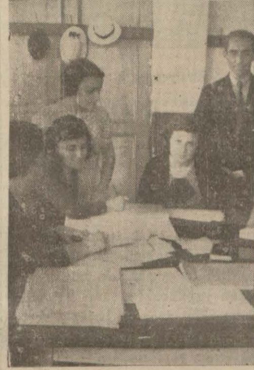
Mekteplerde dünkü kayıt işlerini gösteren iki resim